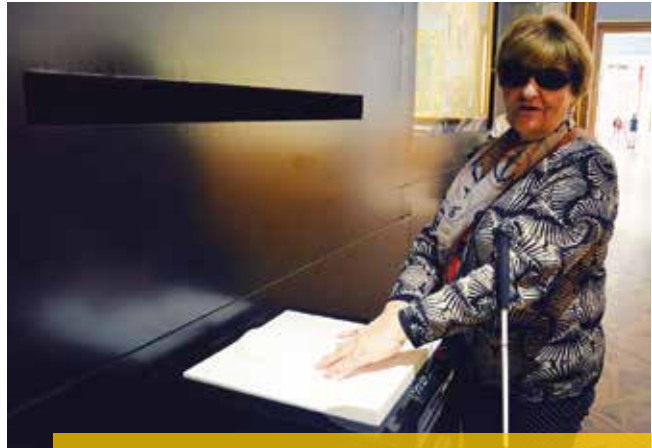
Eine spanische Touristen beim Ertasten des Reliefs von Gustav Klimts Kuss

weil der Neigungswinkel der barocken Rampen einfach zu steil ist. Man muss im Denken